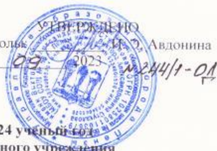
График оценочных процедур 1–11-х классов на 2023/24 учебный год муниципального бюджетного общеобразовательного учреждения средней общеобразовательной школы №66 г. Пензы имени Виктора Александровича Стукалова